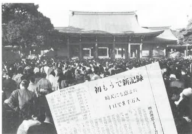
不安の時代の幕あけを象徴するかのようにな...