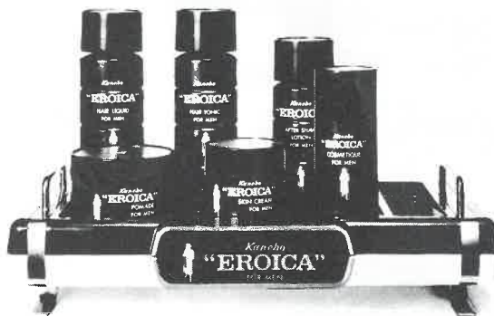
紳士用化粧品エロイカシリーズ

エロイカのあの独特の清涼感とまろやかさ、心にゆとりを生む気品ある香り。英雄は英雄を知るとか。エロイカは、おたくのサウナに一級のお客さまを呼ぶでしょう。